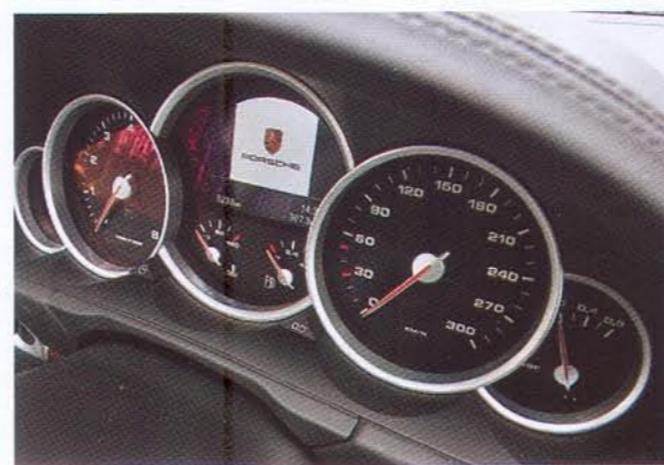
В SPEEDART АКТИВНО ИСПОЛЬЗОВАЛИ КАРБОН НЕОБЫЧНОГО ЦВЕТА В ОФОРМЛЕНИИ САЛОНА

с ним поближе – уже в привычном для мира тюнинга Porsche антураже загородных дорог в окрестностях Штутгарта. Любопытно, что на контрасте с основными конкурентами в speedART даже в своем флагманском комплекте допускают сохранение серийного бампера. Его в компании дооснащают накладкой собственного спойлера. И вот первая приятная неожиданность: получилось не только эффектно, но и элегантно. Этот спойлер имеет классическое для автомобилей Porsche разделение пространства воздухозаборника на 3 секции – центральную и пару боковых. При этом по его краям размещены и крохотные кругляши дополнительных фар. Без сомнения, уже сам по себе передний спойлер speedART привносит интригу в переднюю часть кузова Cayenne. Но также он аккуратно переходит в расширители передних колесных арок. Собственно, эти преобразованные передние крылья уже можно считать визитной карточ-