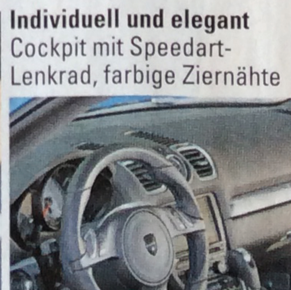
Individuell und elegant Cockpit mit Speedart- Lenkrad, farbige Ziernähte