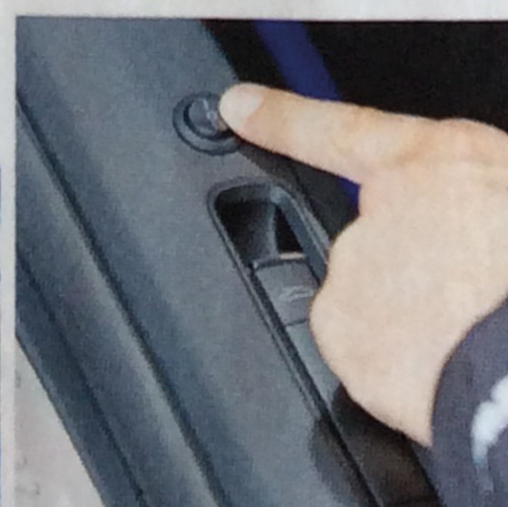
Kerniger und kräftiger Die Klappenabgasanlage wird per Schalter gesteuert