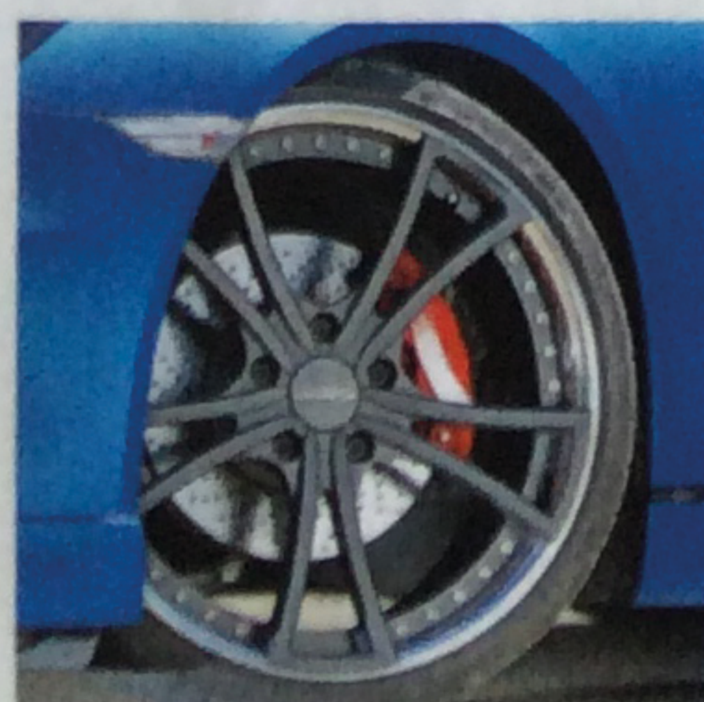
Größer und tiefer 21-Zoll-Radsatz und Tieferlegung um 25 mm