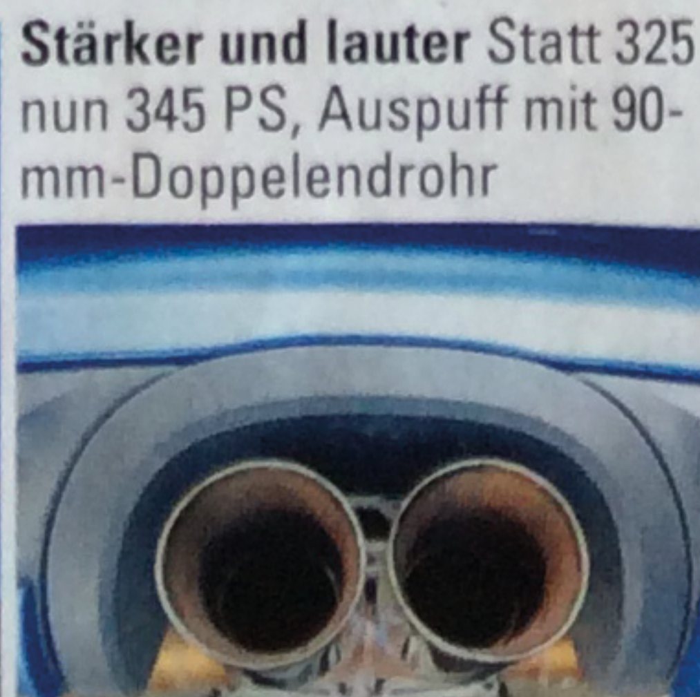
Stärker und lauter Statt 325 nun 345 PS, Auspuff mit 90- mm-Doppelendrohr