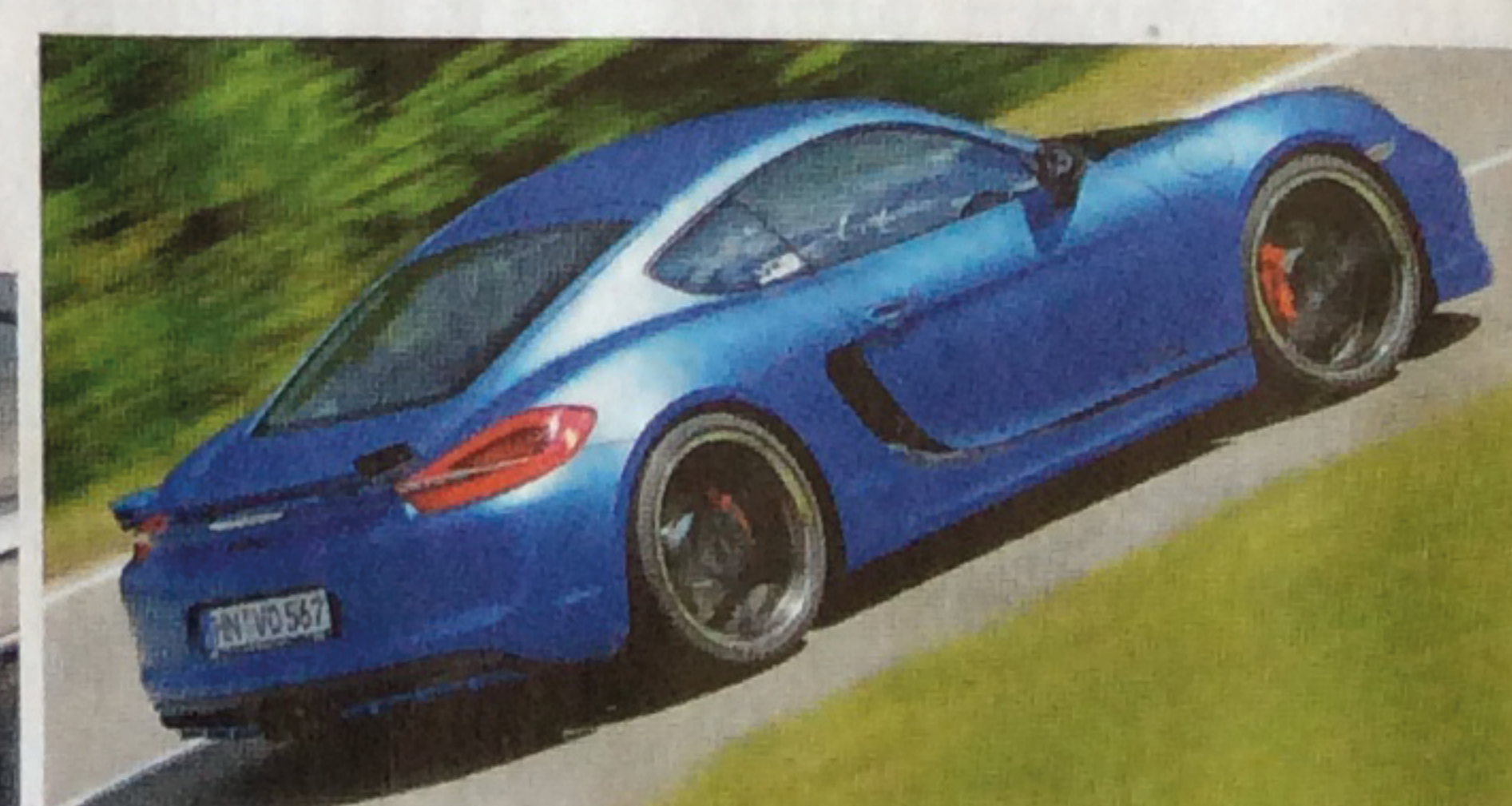
Kantiger und muskulöser Aero-Paket mit Frontspoiler, Heckflügel und Diffusor